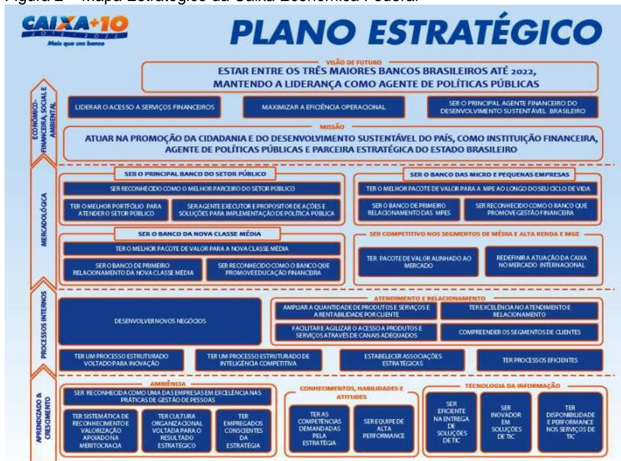
Figura 2 – Mapa Estratégico da Caixa Econômica Federal

Segue abaixo o plano estratégico da caixa: