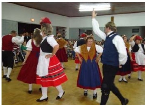
Imagem 3 - Grupo Folclórico Tanzen Freude und Liebe

Fonte: Prefeitura Municipal de São Bonifácio/Secretaria Municipal de Cultura e Turismo (2015).