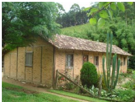
Imagens 1a e 1b - Casas Típicas em Estilo Enxaimel

de casas em estilo enxaimel do estado de Santa Catarina. As imagens 1a e 1b apresentam esse estilo arquitetônico bastante apreciado pelos turistas que visitam o município.