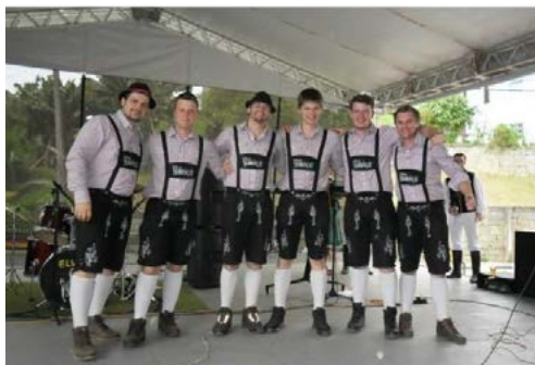
Imagem 2 - Grupo Humanação